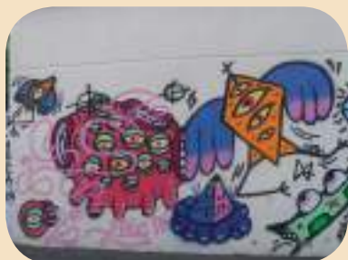
Photo 1 - Street Art